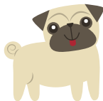
Jugar con su perrihija